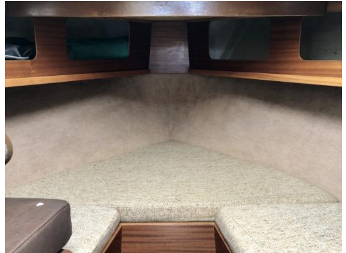
Bugkoje Ansicht 2