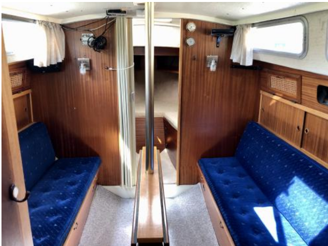
Salon Ansicht 1