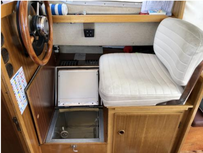
Fahrstand mit Kühlbox