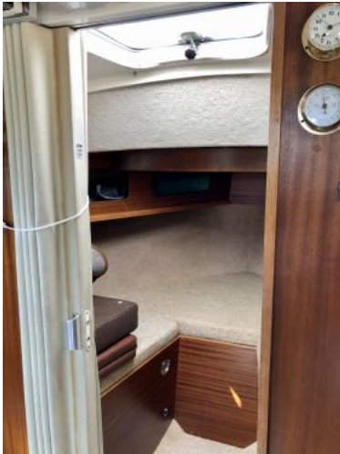
Bugkoje Ansicht 1