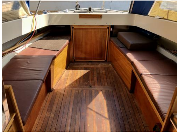
Cockpit Ansicht 2