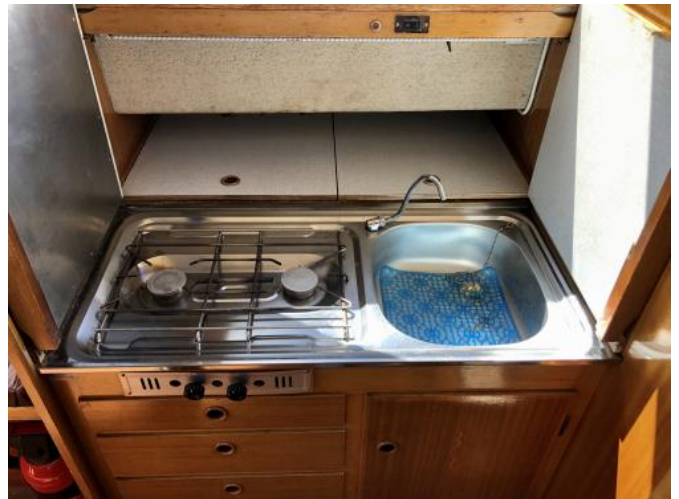
Pantry im Cockpit Ansicht 2