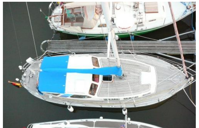
Blick auf das Deck