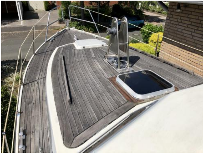
Teakdeck Ansicht 1