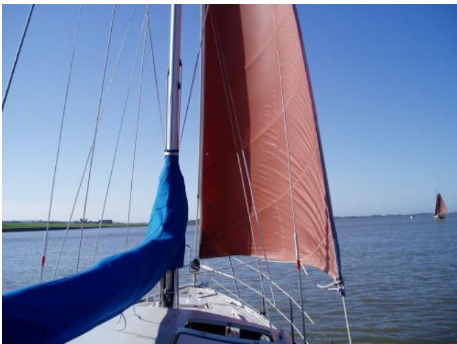
Unter Segel Ansicht 1