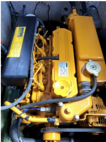
Vetus Type M415A102A