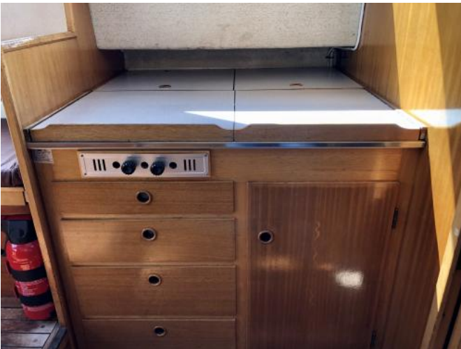
Pantry im Cockpit Ansicht 1