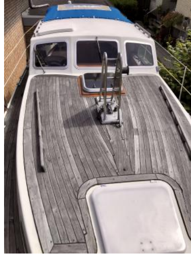
Teakdeck Ansicht 3