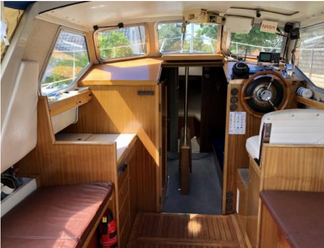
Cockpit Ansicht 1