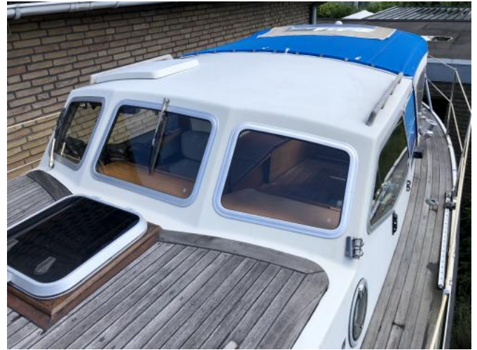
Teakdeck Ansicht 2