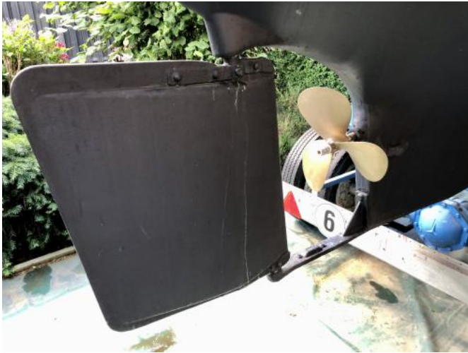
Ruder Ansicht 1