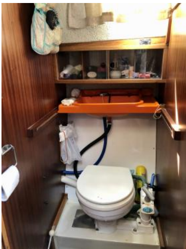
WC-Raum mit See-WC