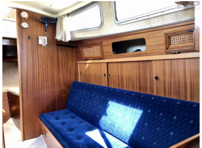
Salon Ansicht 2