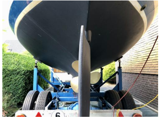
Ruder Ansicht 2