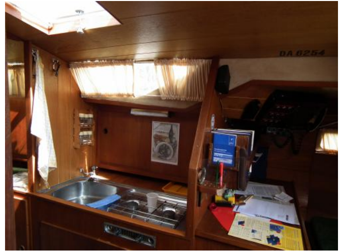
Pantry mit Kartentisch