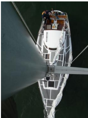
Blick vom Mast