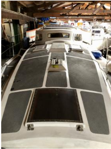
Vorschiff Ansicht 3