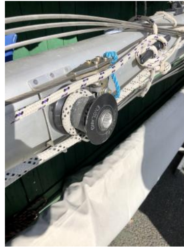
Maßt Ansicht 2