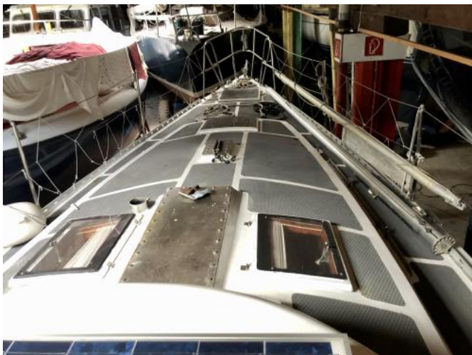
Blick auf das Vorschiff Ansicht 2