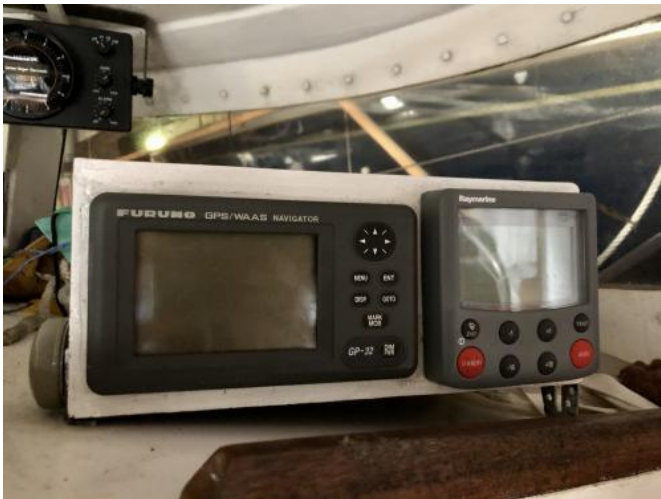
Navigationinstrumente Ansicht 1