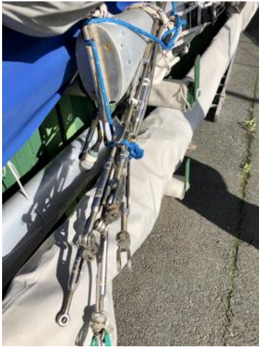
Maßt Ansicht 1