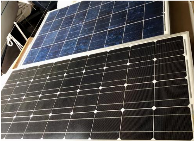
Solarpanele zur Batteriespeisung