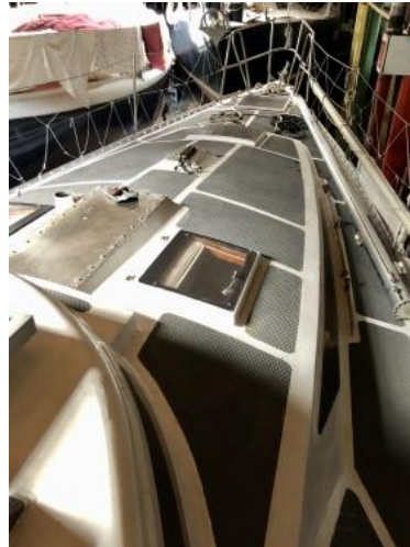
Blick auf das Vorschiff Ansicht 1