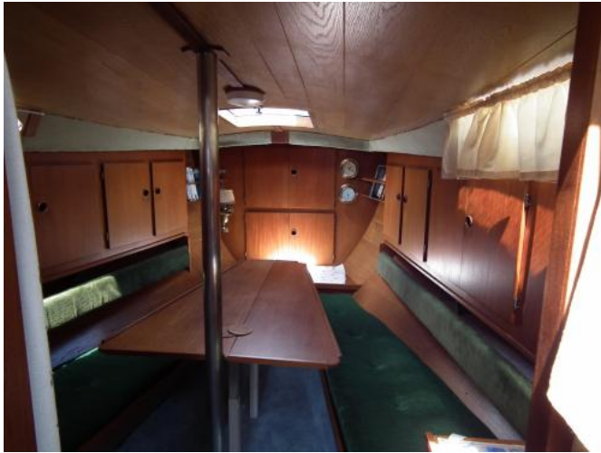
Sitzecke im Bug