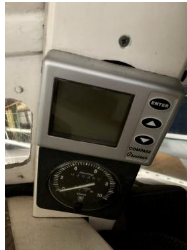
Navigationinstrumente Ansicht 2