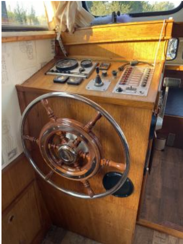
Innenfahrstand Ansicht 1