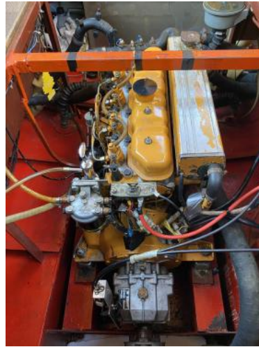
Motor Ansicht 3