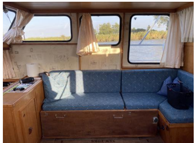
Salon Ansicht 3