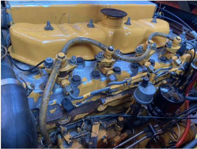
Motor Ansicht 2