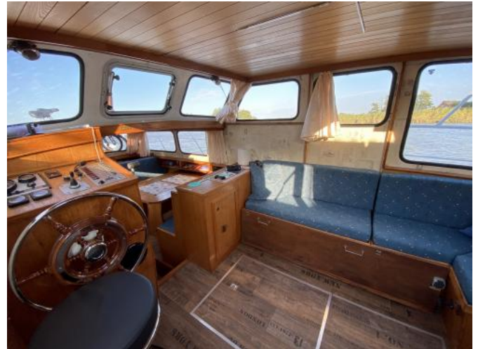
Salon Ansicht 1