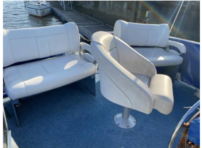
Freideck Ansicht 2