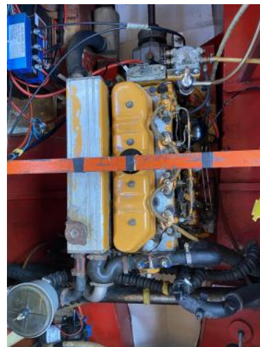
Motor Ansicht 1