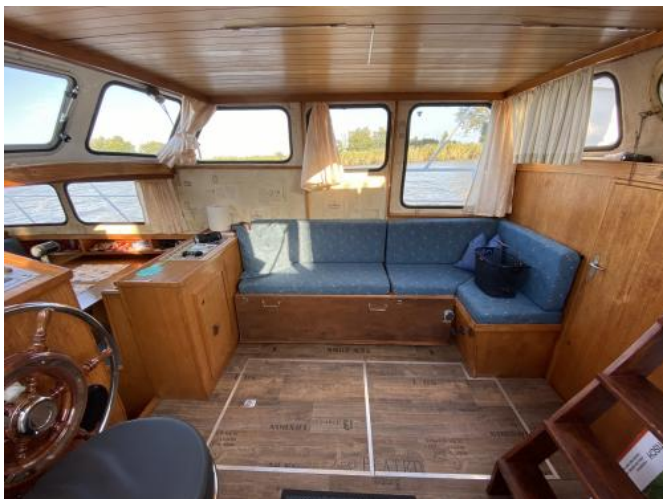
Salon Ansicht 2