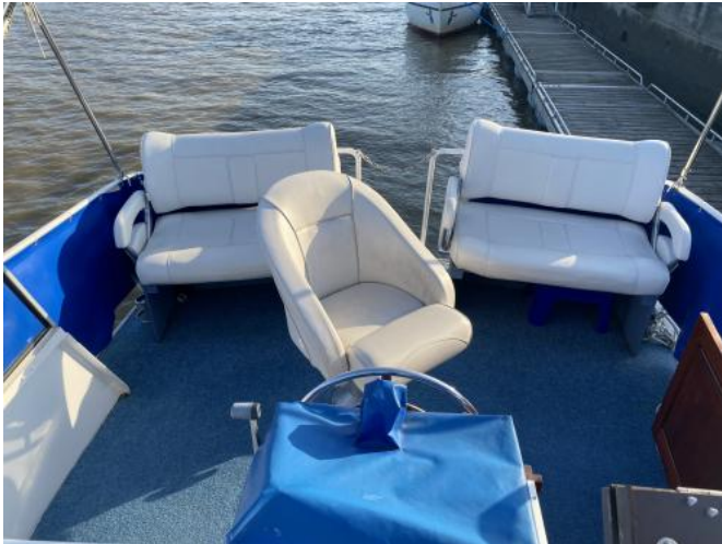
Freideck Ansicht 1