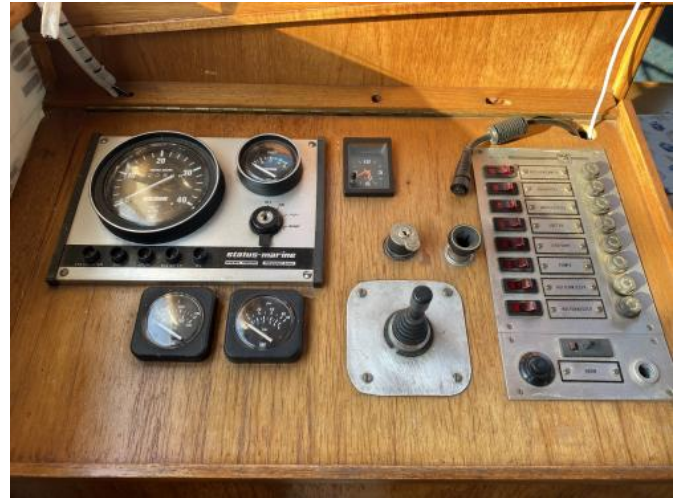
Innenfahrstand Ansicht 2