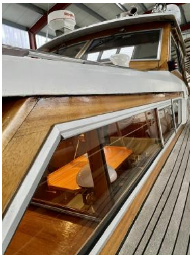
Scheibenrahmen Ansicht 2