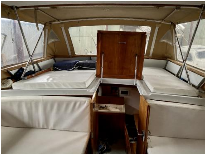
Cockpit Ansicht 2