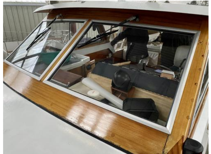
Scheibenrahmen Ansicht 1