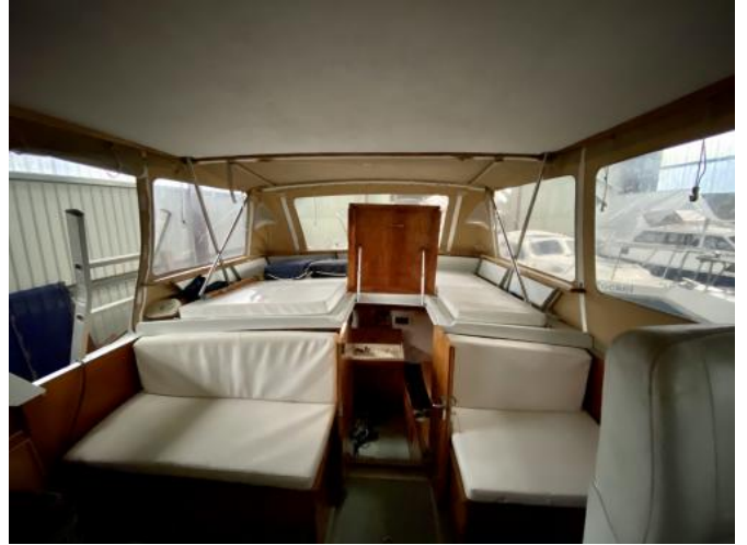
Cockpit Ansicht 1