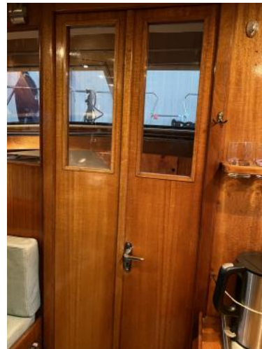
Durchgang zur Bugkoje