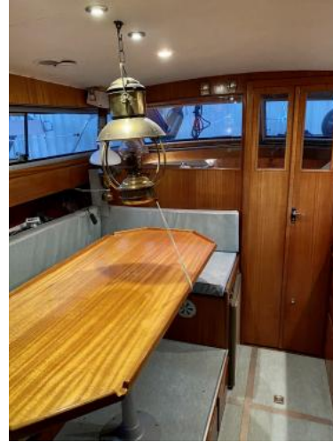
Salon Ansicht 3