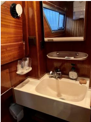
WC-Raum Ansicht 2