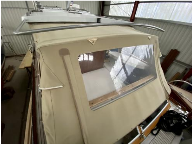
Persenning Ansicht 2