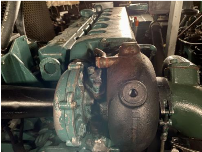
Motoren Ansicht 2