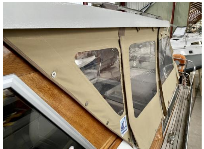
Persenning Ansicht 1