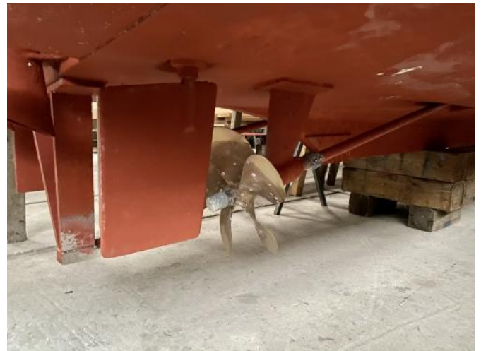
Unterwasserschiff Ansicht 2