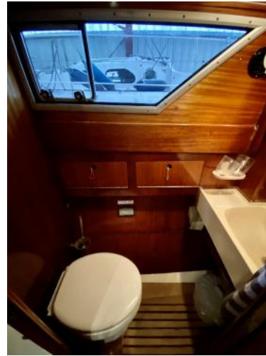
WC-Raum Ansicht 1