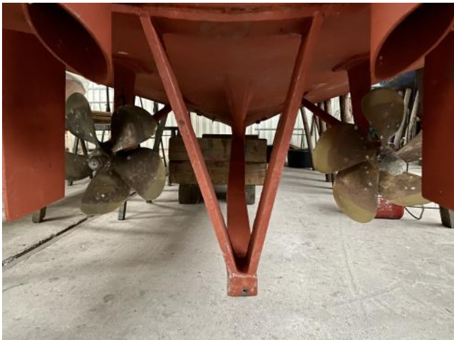
Unterwasserschiff Ansicht 1