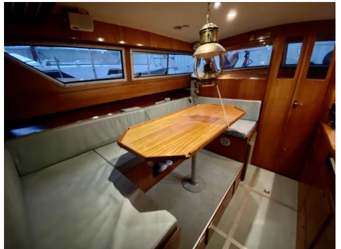
Salon Ansicht 1