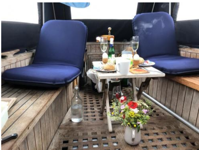
Cockpit Ansicht 3