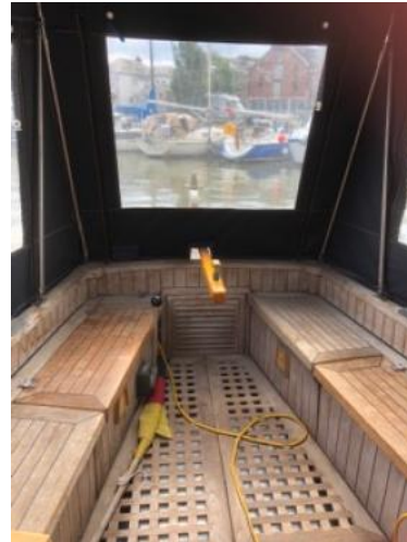
Cockpit Ansicht 2