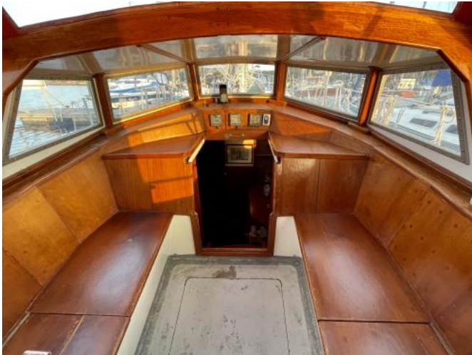
Cockpit Ansicht 1