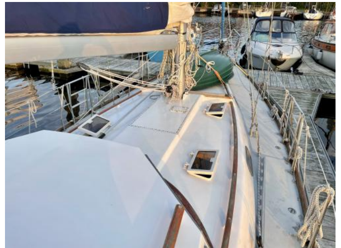
Deck Ansicht 1