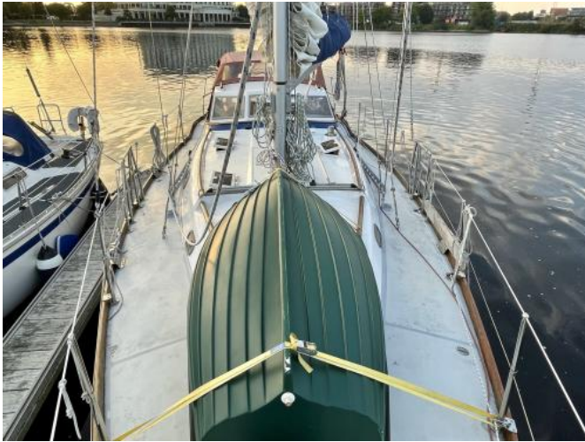
Deck Ansicht 2