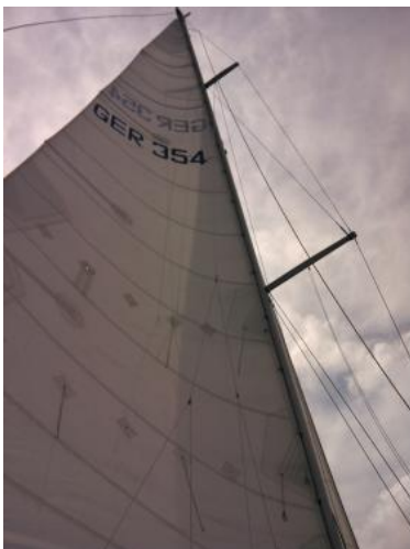
Großsegel Ansicht 2