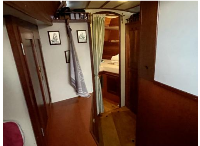
Durchgang zur Bugkoje u. zum WC-Raum