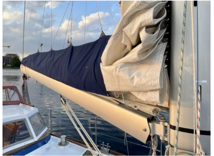
Großsegel Ansicht 1