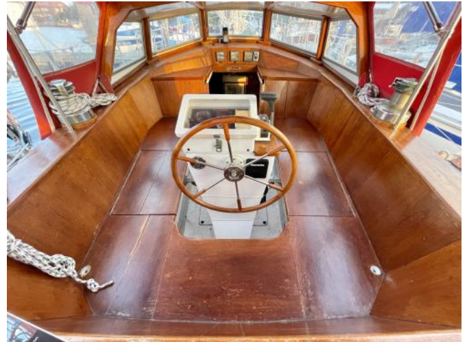
Cockpit Ansicht 2