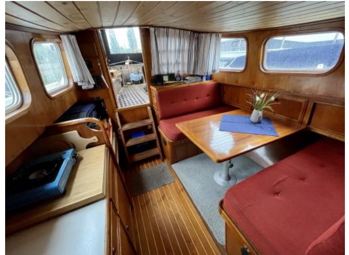
Salon Ansicht 3