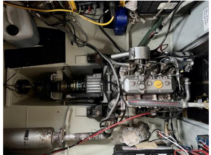
Motorraum Ansicht 1