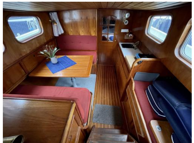
Salon Ansicht 1