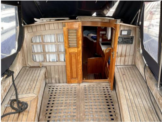
Cockpit Ansicht 1