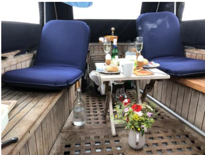
Cockpit Ansicht 3