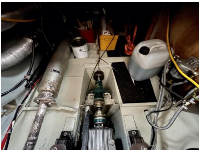
Motorraum Ansicht 2