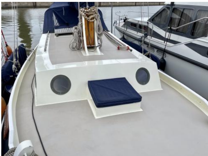
Deck Ansicht 1