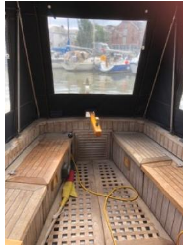
Cockpit Ansicht 2