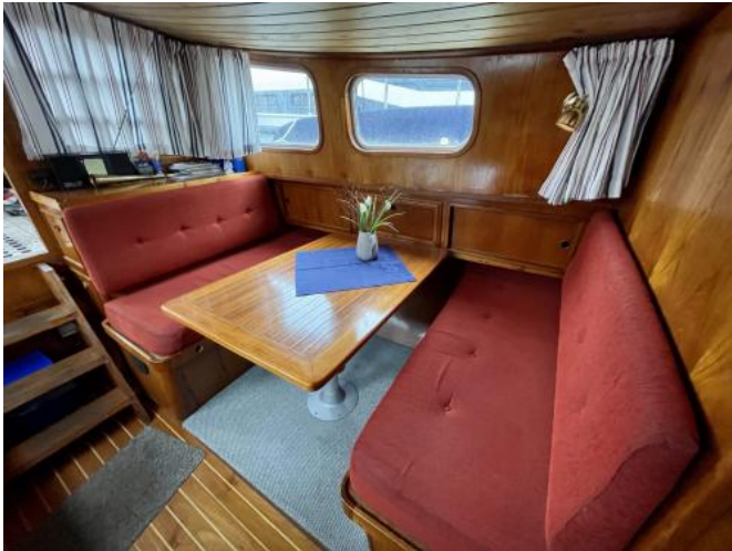
Salon Ansicht 2