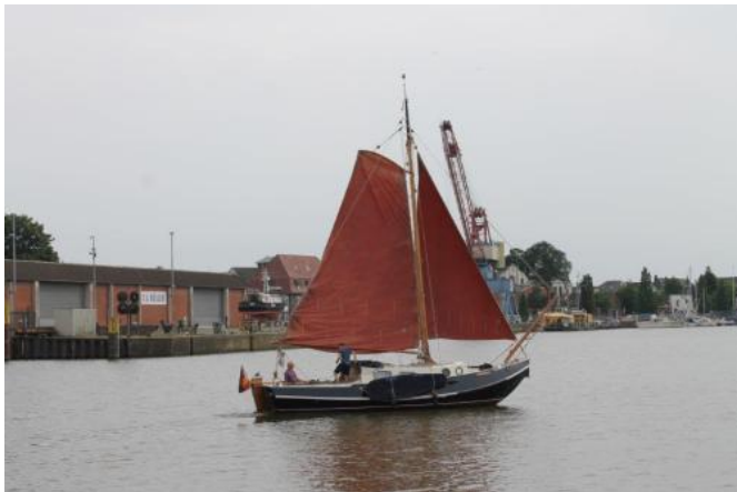
Unter Segel Ansicht 1