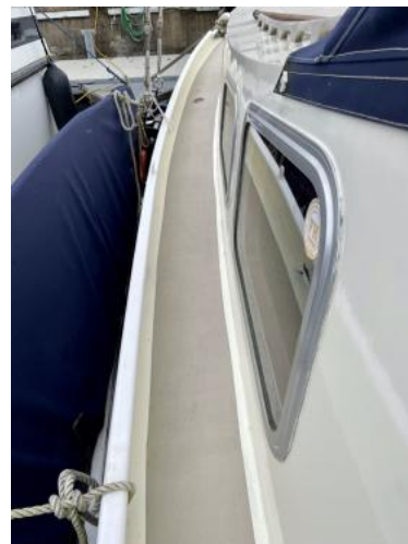
Deck Ansicht 2