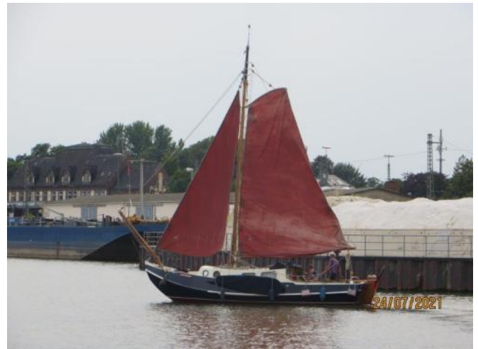
Unter Segel Ansicht 2