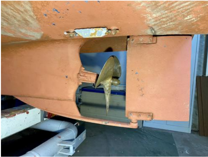
Unterwasserschiff / Propeller