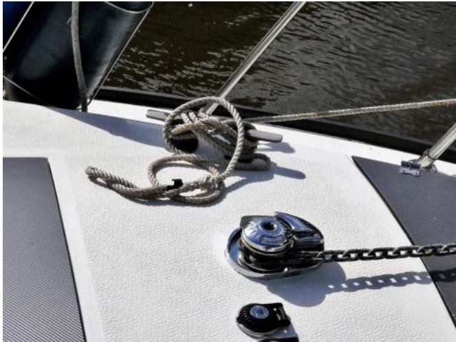
Deck / Ankerwisch