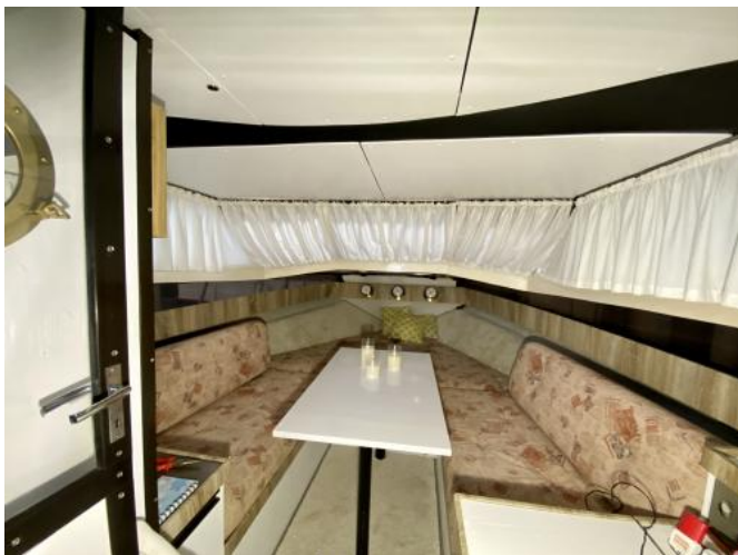
Kabine Ansicht 1