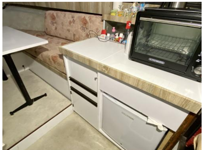
Kabine Ansicht 2