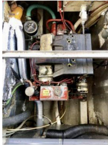
Volvo Penta BB140A