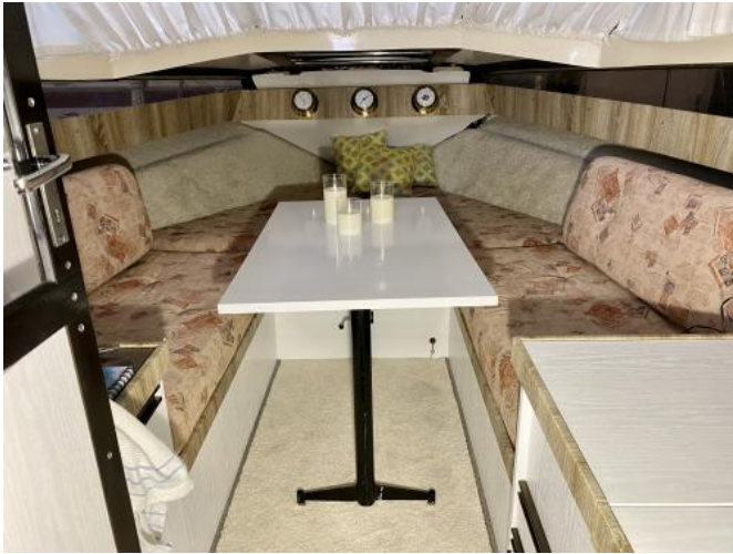
Kabine Ansicht 3