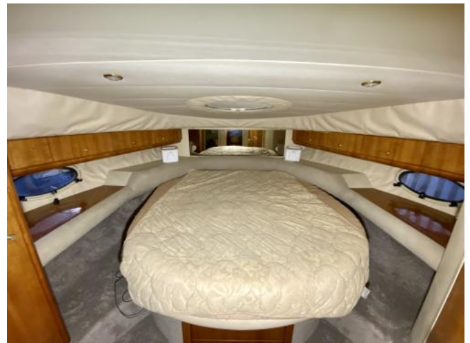
Bugkabine Ansicht 1