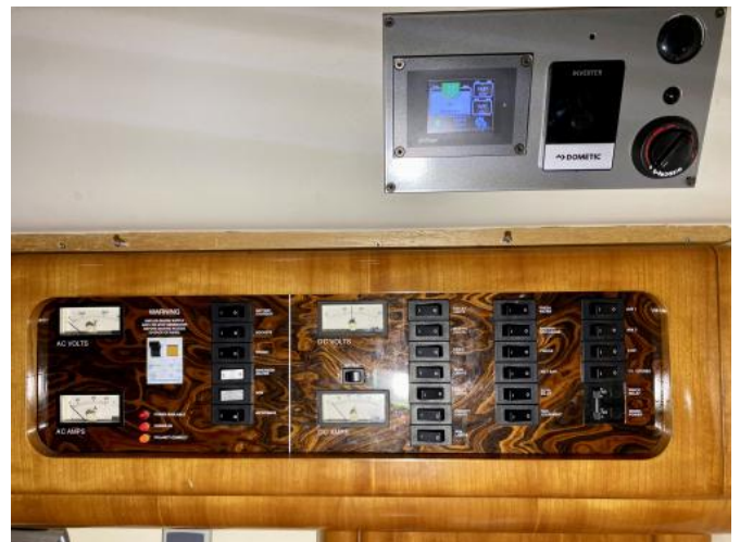
Elektrik Ansicht 1