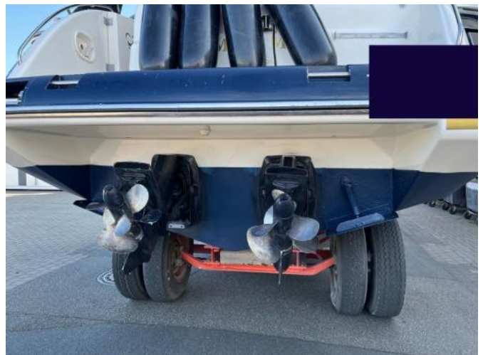
Heckansicht / Antriebe