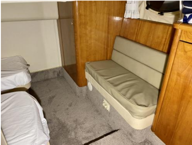
Achterkabine Ansicht 1