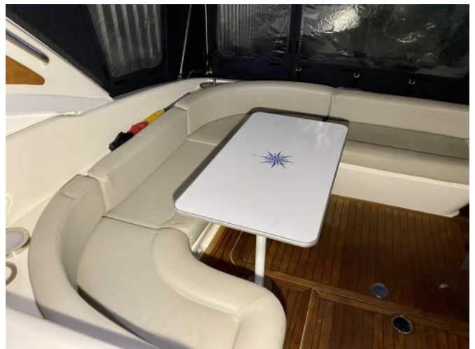
Cockpit / Polster Ansicht 1