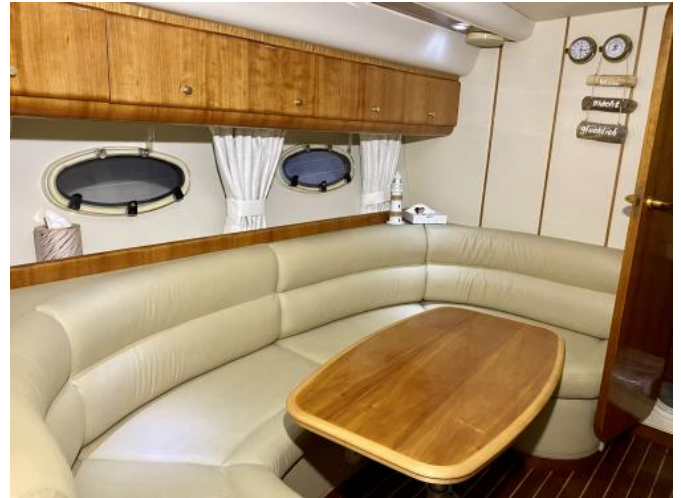
Salon Ansicht 3