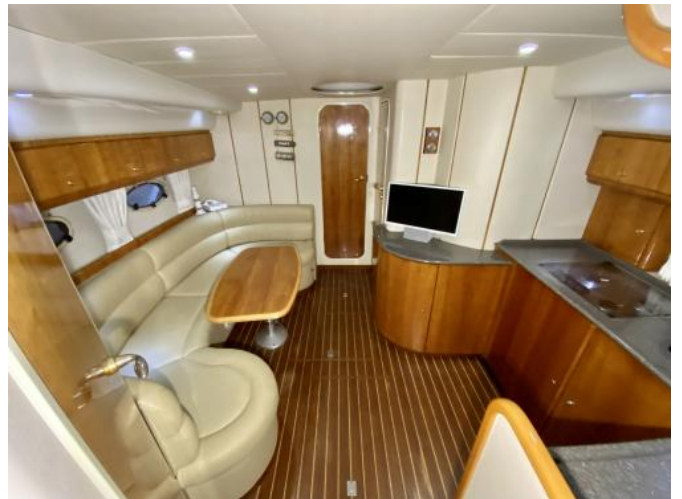
Salon Ansicht 1