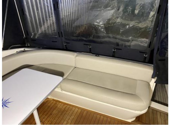
Cockpit / Polster Ansicht 3