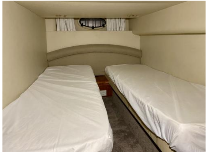
Achterkabine Ansicht 2