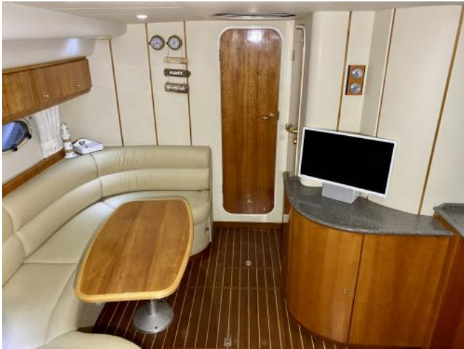
Salon Ansicht 2