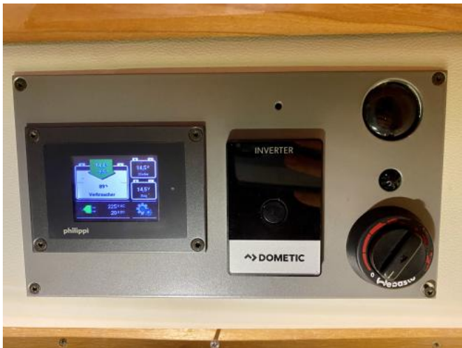
Elektrik Ansicht 2