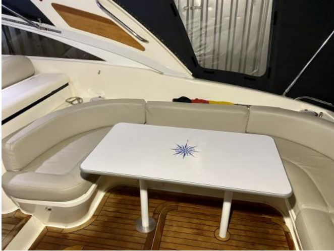
Cockpit / Polster Ansicht 2