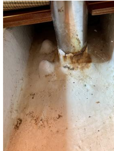
Bilge Ansicht 1