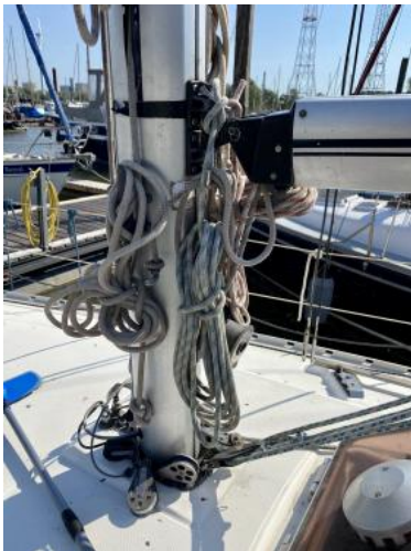
Mast / Mastfuß Ansicht 1