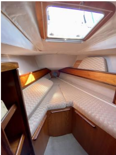
Bugkabine Ansicht 2