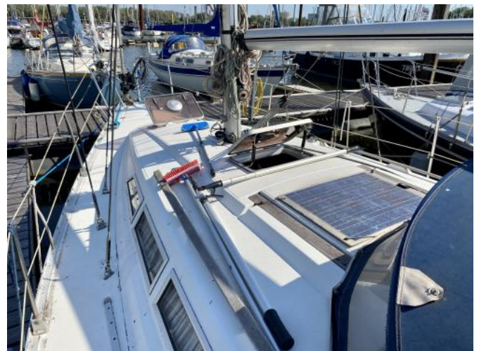
Deck Ansicht 3