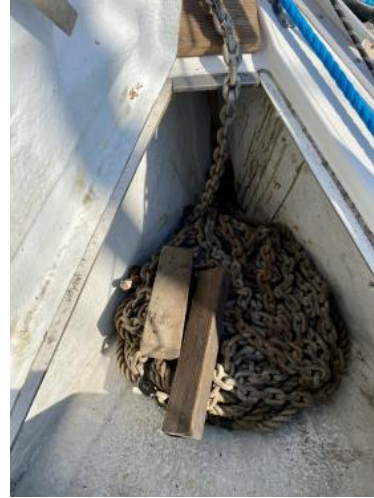
Ankerkasten Ansicht 2