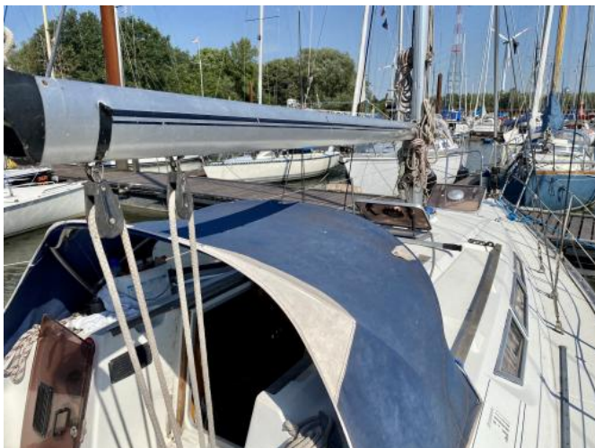
Deck Ansicht 2