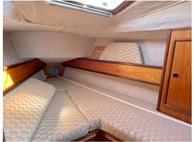
Bugkabine Ansicht 1