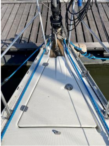
Ankerkasten Ansicht 1