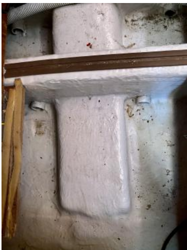
Bilge Ansicht 2