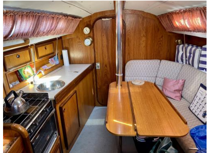
Salon Ansicht 1