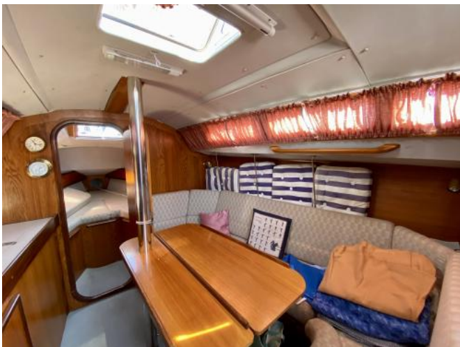
Salon Ansicht 2