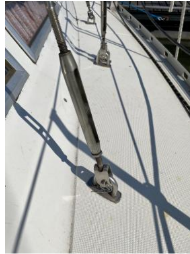
Deck Ansicht 1