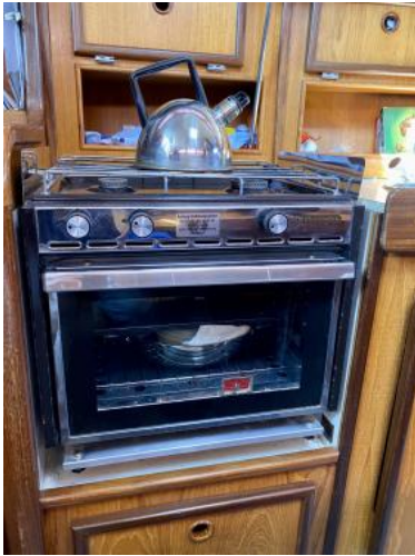
Herd / Backofen