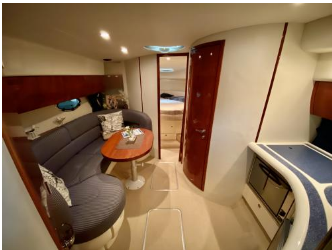
Salon Ansicht 1