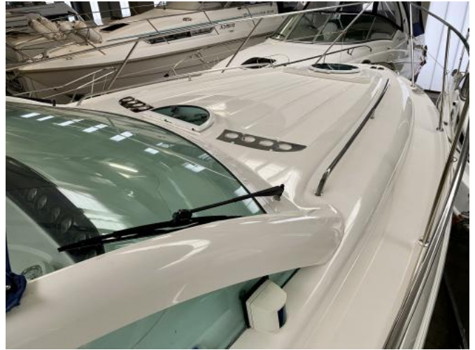
Deck Ansicht 2