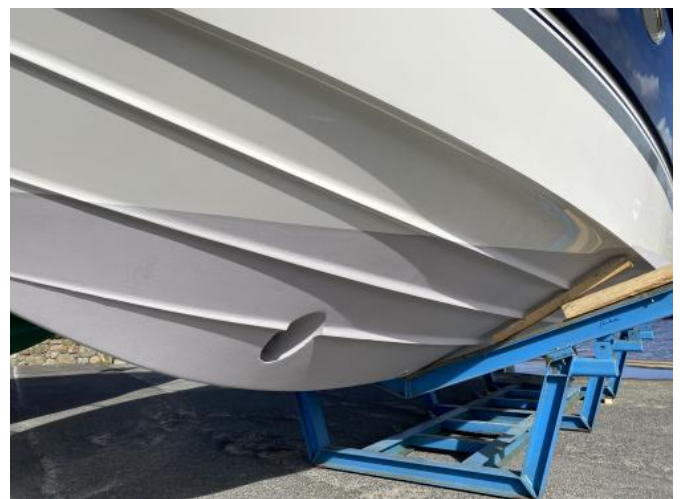
UW-Schiff Ansicht 1