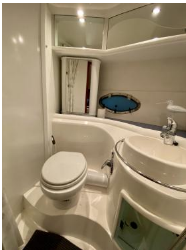
WC-Raum Ansicht 1