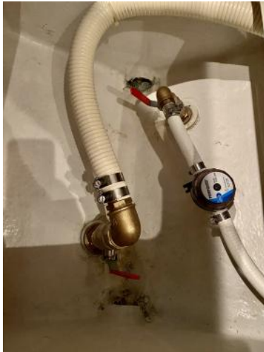
Seeventile neu 2021