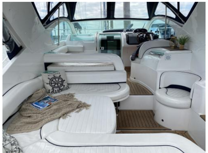
Plicht / Cockpit