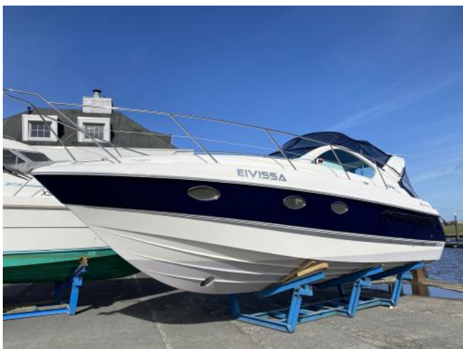
Ansicht auf Lagerbock